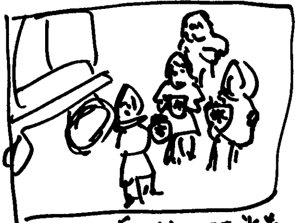
町民センターで夏休みにアイス作りをする小学生たち。

法人設立から2年たった今年度の春・夏の活動は「和歌山市民活動研究会」や「和歌山町民センター」を中心に順調にすすんでいます。当番の活動充実を目指し、地域からの関心もあつたようです。