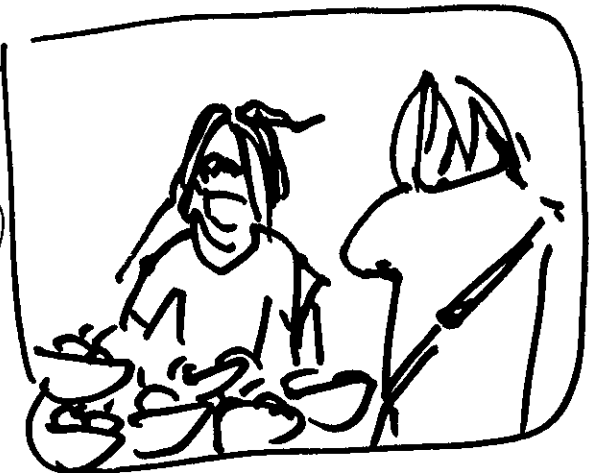
和歌山の観光に実習する大学生(2021年)

現在の117超では地域に企業との関わりを強化しています。市民活動が不足しないよう、 地域 市民(活動)のバリエーションを多様に活動に活かしていただく企業と、117超の強みを生かして一緒に活動の発展を目指していただく企業と。相談、問い合わせ、冷やかしたり、楽しいスリッパからお入りください。