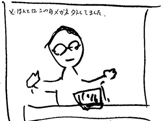
※寺小屋のためとをみはりに要する 名取後

6/26(水)に市民活動研究会を創りました。今日は地区 集会所の利用も同じように名取後援補給が長年思っ ていた寺小屋(≒学習支援)活動の案と相談して 検討しました。「4-2検討会」と銘付、実現可能性 が見込めて真実に協賛しました